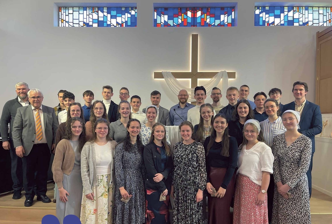
/ dem Herrn sei Dank für diesen Einsatz

„ Denn ich schäme mich des Evangeliums von Christo nicht; denn es ist eine Kraft Gottes, die da selig macht alle, die daran glauben. Römer 1,16