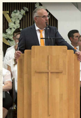
/ Thema der diesjährigen Missionstage:

Nur wer nach dem Betreten der Tür in Gemeinschaft mit Christus auch bleibt, kann die Frucht des Geistes – Liebe – in seinem täglichen Leben erfahren. Gott will eine Beziehung zu dir und zu mir. Diese ist es, die uns hält und trägt, auch wenn es schwer wird, sonst „ vertrocknen “ wir.