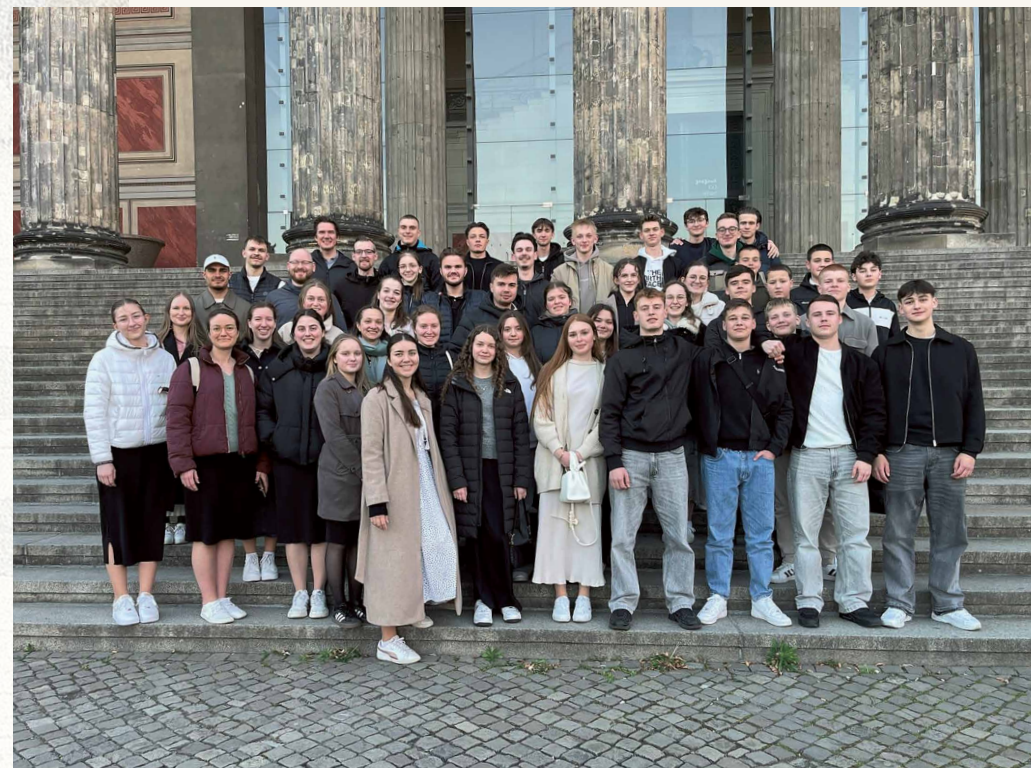
/ Missionseinsatz am Brandenburger Tor