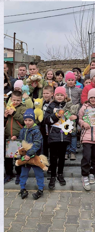
/ Hoffnung im Kinderheim

Gegen 11:30 Uhr reisten wir weiter zur nächsten Gemeinde. Dort wurden wir herzlich mit traditionellem Borschtsch