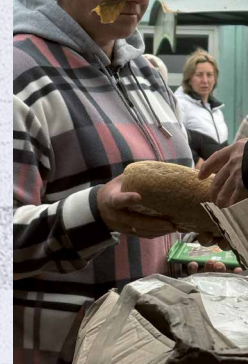
/ Verteilung von Brot an Bedürftige