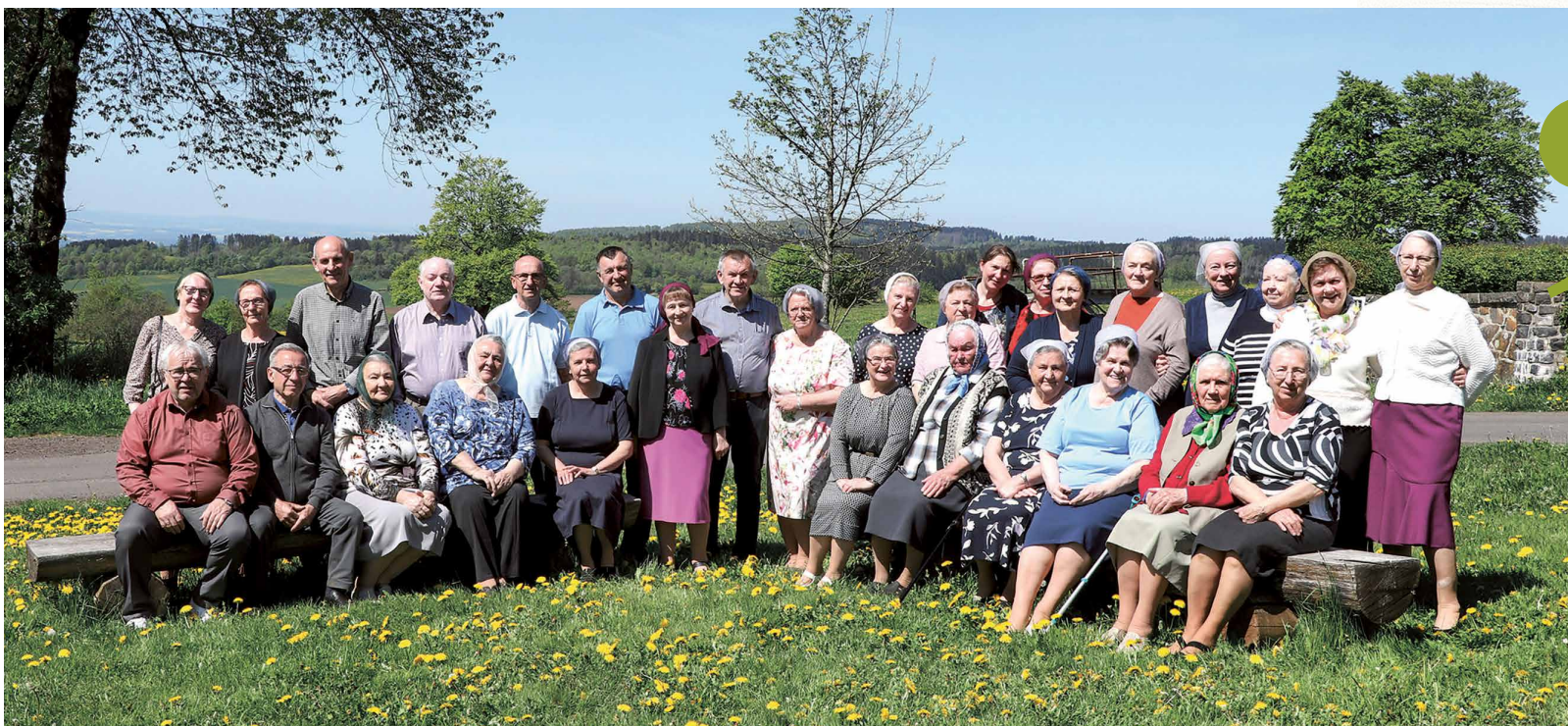
/ Teilnehmer der Seniorenbibelwochen