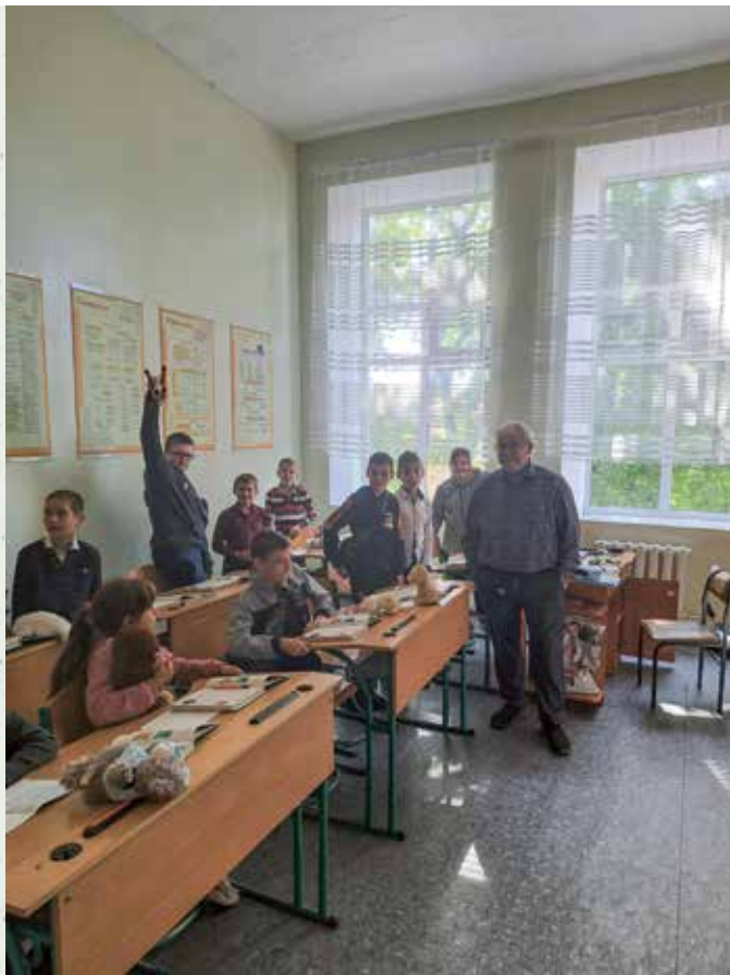
Besuch einer Schule im Kinderheim

Ukraine hat einiges in den Gemeinden bewirkt, so dass viele Menschen in den Gottesdienst kommen, aber auch mit Angst beladen sind.