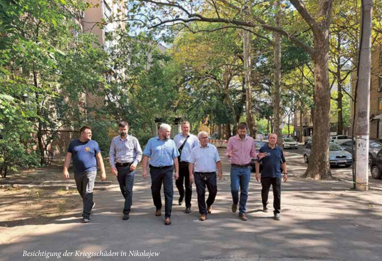
Besichtigung der Kriegsschäden in Nikolajew