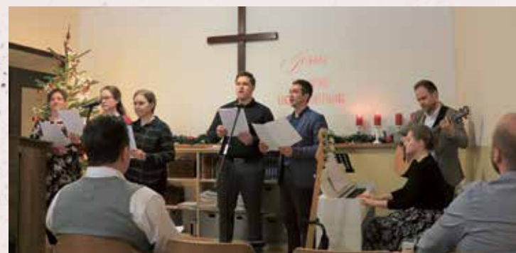
Gestaltung des Sonntags- gottesdienstes der Abschlussklasse