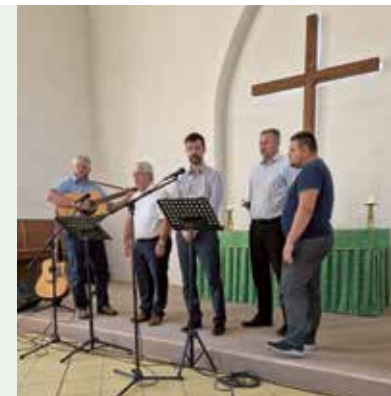
Evangelisation in Nikolaew

ten uns einen Tisch vor. So verbrachten wir die Begegnung mit Gemeinschaft und Gesprächen. Mit ganz viel Männerkraft wurden die Hilfsgüter ausgeladen und den jeweiligen Gemeinden zugeordnet. Nach einer kurzen Erholung setzten wir uns zusammen und jeder Pastor berichtete die Situation und den Zustand der Gemeinde. Wir brachten alles vor dem Herrn. Der Krieg in der