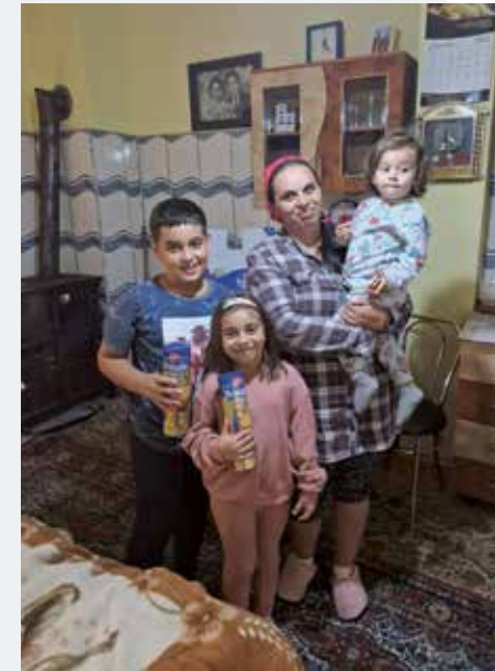
Gruppe aus Deutschland besucht arme Familien in Rumänien