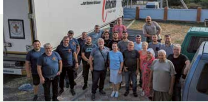
Abladen von humanitärer Hilfe in Odessa

die Gott jedem gab nach seinen Maßen, so dass Ängste in den Hintergrund gelangen und der Herr mit seinen Verheißungen die Herzen erfüllte. Nach jedem Gottesdienst teilten unsere Brüder Grundnahrungsmittel und finanzielle Unterstützung aus. Auch die Schokoladentafeln bereiteten jeden ein Lächeln. Wir waren erstaunt, wie viele Menschen zum Gottesdienst kamen. Wir vermuten, dass der Krieg dazu beitrug, dass Menschen nach Gott fragen und suchen. Fast jede Nacht sind Unruhen im Land durch Angriffe, die wir auch hautnah erlebten, so dass wir in den Bunker rennen und die Zeit dort abwarten mussten, bis wieder Ruhe einkehrte. Die Menschen sind es teils gewohnt und haben ihre Schlafbetten in die Fluren verlegt. In Oktabersk verbrachten wir eine Nacht, die uns die Geschwister im neuen Gemeindehaus vorbereitet hatten. Der Rest des Hauses ist noch im Rohbau, doch nutzt man schon die Räumlichkeiten aufgrund von Platzmangel.