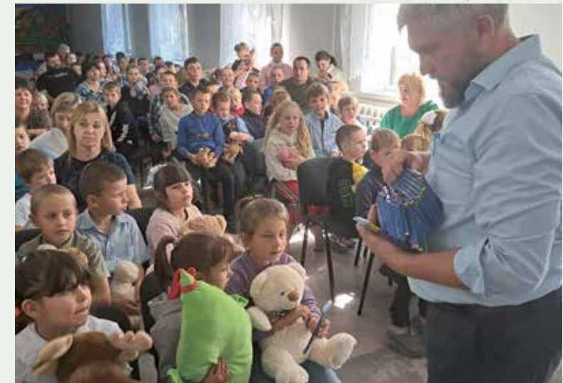
Besuch eines Kinderheims in Balta