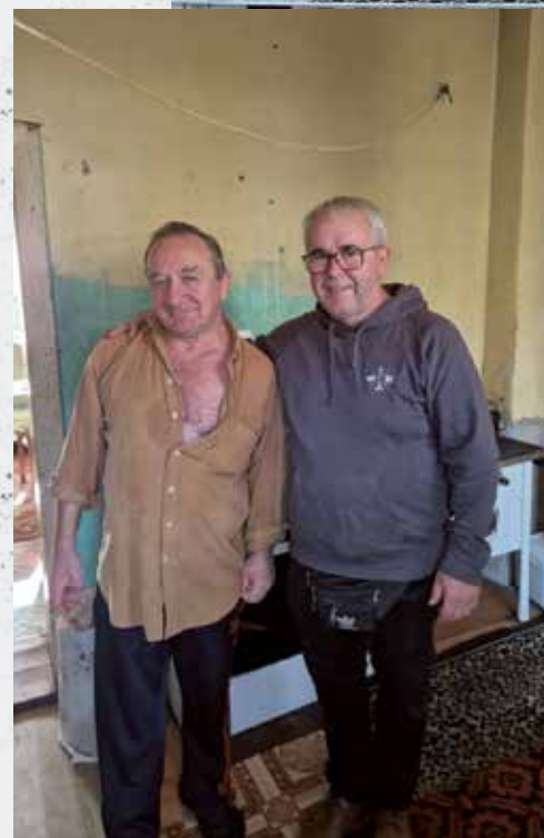
Bfd'ler im Missionseinsatz in Rumänien

Eins durften wir alle auf jeden Fall mitnehmen: Gott hat seine Leute wirklich überall.